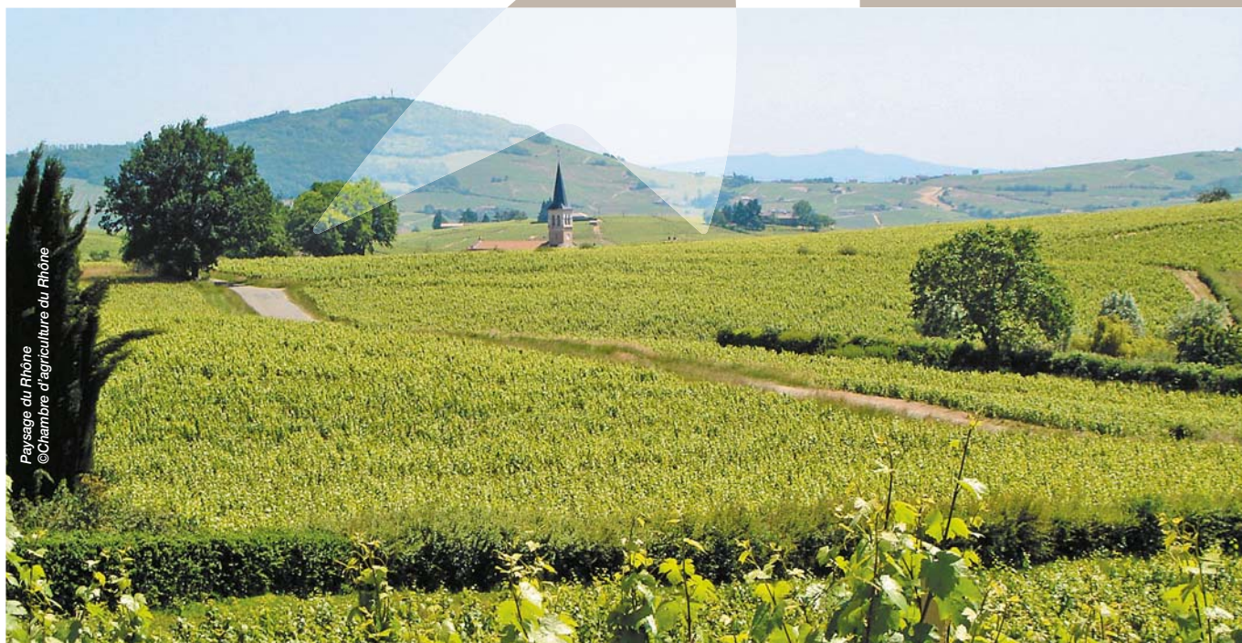
Paysage du Rhône

La sélection de la vigne vise à garantir un haut niveau de qualité sanitaire, agronomique et œnologique sur des pieds de vigne, grâce à un processus de repérage, de conservation et de multiplication. Dans de nombreux vignobles les Chambres d'agriculture sont un acteur incontournable dans la sélection. Les plants et boutures obtenus sont ensuite mis à disposition à la filière.