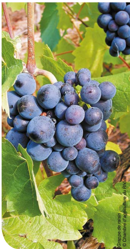
Grappe de raisin

En parallèle, le réseau de fermes Dephy regroupe des exploitations engagées dans une démarche de réduction de l'usage de produits phytosanitaires. Ce réseau dense rassemble des conditions pédoclimatiques diverses, des systèmes de production multiples et différents modes de transformation et commercialisation.