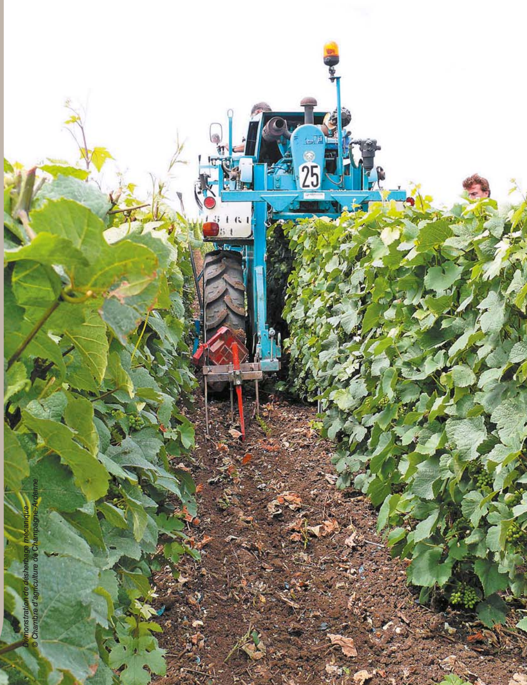
Démonstration de désherbage mécanique